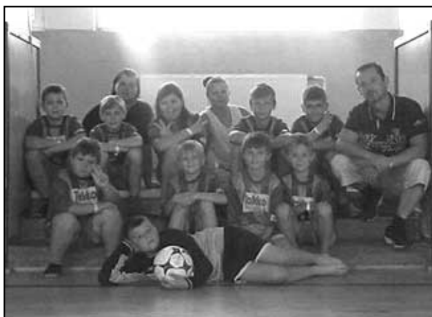
Soustředění přípravky ve Strupčicích.