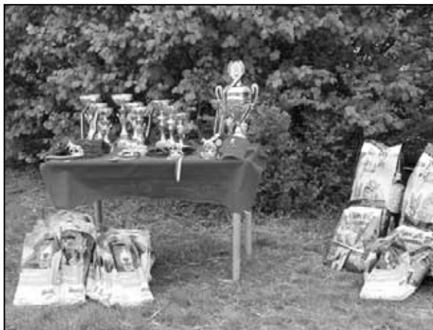
Ceny o které se při závodě bojovalo, spolu s putovním pohárem