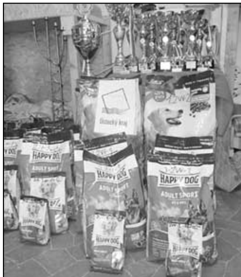
Poháry a věčné ceny