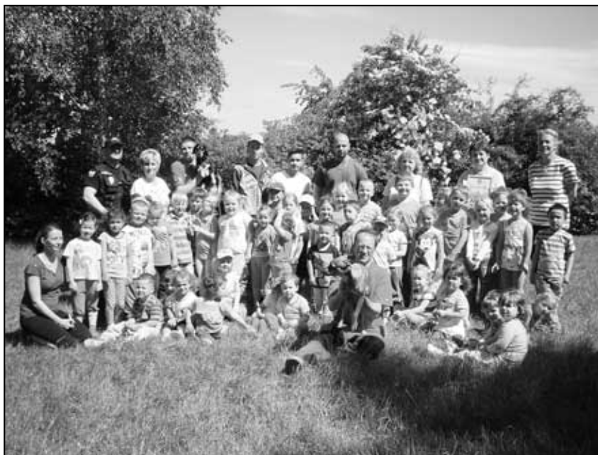
Obecní policie v Bečově. Akce v bečovské školce - záchranáři a strážníci, hasiči.