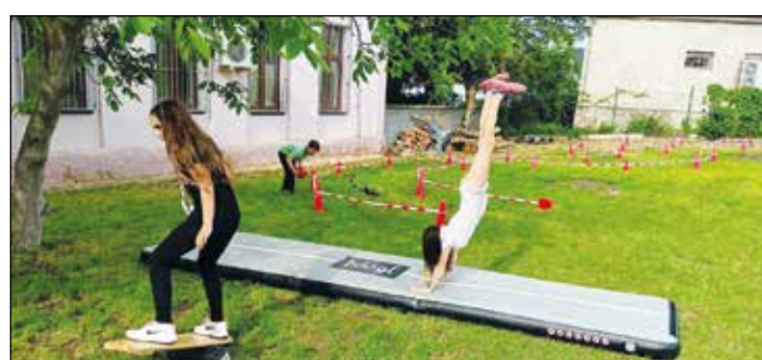
ZÁBAVNÉ ODPOLEDNE. Pěknou akci uspořádala obec v neděli 2. června 2024. Čas konání byl od 14.00 do 18.00 hodin. Děti si užily spoustu atrakcí, modelování balónek a další soutěže.